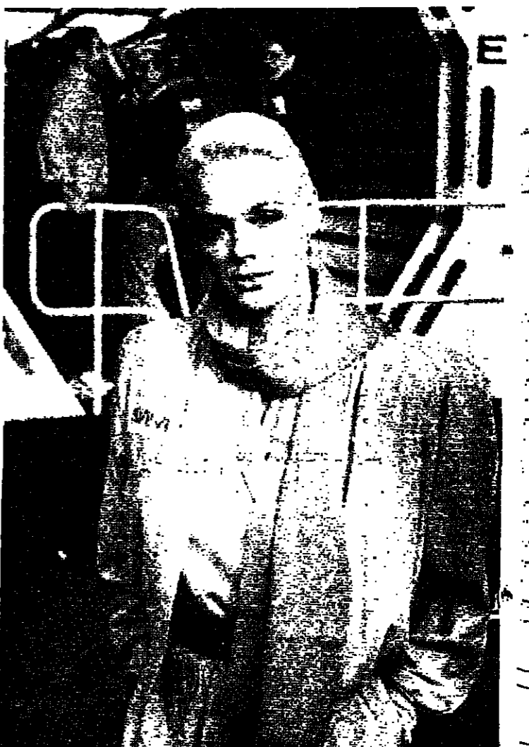
الملكة بريجيت تلسون (الزوجة السابقة للممثل الأمريكي سلفستر ستالوني)، أثناء تمثيلها في آخر فيلم لها، جريمة في ضوء القمر. بريجيت تقوم بدور مفضل اميركي ترسله - نازا - (وكالة الفضاء الاميركية) الى القمر من اجل تسوية مشكل معين، فتلق هناك في حب نظيرها السوفييتي ويحلان المشكله معا.